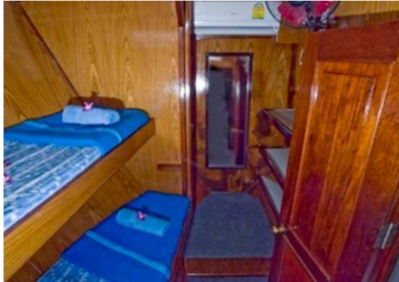
Deluxe Kabine mit Stockbetten